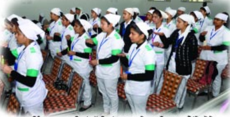
ਨਰਸਿੰਗ ਕਾਲਜ ਦੀਆਂ ਬੱਚੀਆਂ ਸਮਾਜ ਸੇਵਾ ਦੀ ਸ਼ੁਰੂਆਤ ਲੈਂਦੇ ਹੋਏ।