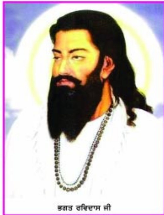
ਭਗਤ ਰਵਿਦਾਸ ਜੀ

ਜਿਹੜਾ ਆਪ ਜਪਦਾ ਹੈ ਤੇ ਦੂਸਰਿਆਂ ਨੂੰ ਇਸ ਰਸਤੇ ਲਾਉਂਦਾ ਹੈ, ਮਹਾਰਾਜ ਕਹਿੰਦੇ ਅਸੀਂ ਪੂੜੀ ਮੰਗਦੇ ਹਾਂ ਭਾਈ ਉਹਦੀ। ਐਵੇਂ ਹੀ ਨਾ ਸਮਝਿਓ।