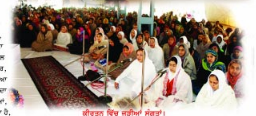
ਕੀਰਤਨ ਵਿੱਚ ਜੁੜੀਆਂ ਸੰਗਤਾਂ।