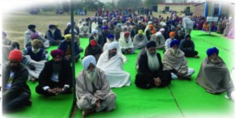
ਕੀਰਤਨ ਵਿੱਚ ਜੁੜੀਆਂ ਸੰਗਤਾਂ।

ਜਦੋਂ ਨਾਮ ਹਿਰਦੇ 'ਚ ਵਸ ਗਿਆ, ਸਰੀਰ ਵਿਚ ਵਸ ਗਿਆ, ਫੇਰ ਸਰੀਰ ਪਵਿੱਤਰ ਹੋ ਜਾਂਦਾ ਹੈ। ਨਾਮ ਜਪਣ ਵਾਲਾ ਜਿੱਥੇ ਚਰਣ ਧਰ ਦੇਵੇ ਉਹ ਧੂੜਾ ਪਵਿੱਤਰ ਹੋ ਜਾਂਦੀ ਹੈ ਤੇ ਮਹਾਰਾਜ ਕਹਿੰਦੇ, ਇਹ ਧੂੜੀ ਐਨੀ ਪਵਿੱਤਰ ਹੋ ਜਾਂਦੀ ਹੈ ਕਿ ਉਹਨੂੰ ਦਾਨ ਦੇ ਰੂਪ ਵਿਚ ਪ੍ਰੇਸ਼ਰ ਤੋਂ ਮੰਗ ਕਰਦੇ ਨੇ।