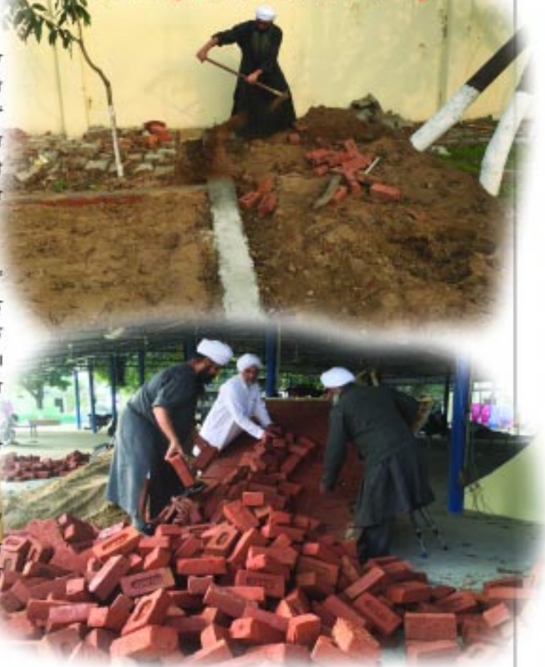
ਨਿਕਲਣ ਡੇਰਾ ਹਿਰਦਾਪੁਰ ਖੇਤੀ (ਨੇੜੇ ਬਿੰਦਰਖ), ਕਾਰਜੋਦਾ ਦਿਸ਼।

ਜਿਸ ਤਰ੍ਹਾਂ ਦੇ ਨਾਲ ਬੱਕ ਸਾਡੀ ਹੋਸੀਅਤ ਨਾਪਦੇ ਨੇ ਕਿ ਆਹ ਬੰਦੇ ਦੀ ਐਨੀ ਹੋਸੀਅਤ ਹੈ ਕਿ ਇਹਨੂੰ ਐਨੇ ਹਜ਼ਾਰ ਕਰਜ਼ਾ ਦੇ ਦਿਓ। ਕਿਸਾਨ ਵੀ ਜਾਣਦੇ ਨੇ, ਵੈਕਟਰੀਆਂ ਵਾਲੇ ਵੀ ਜਾਣਦੇ, ਇਡਸਟਰੀਆਂ ਵਾਲੇ ਜਾਣਦੇ ਨੇ ਕਿ ਐਨੀ ਲਿਮਟ ਮੇਰੀ ਵਿਕਸ ਹੋਈ ਹੈ, ਐਨਾ ਕਰਜ਼ਾ ਮੈਂ ਚੁੱਕ ਸਕਦਾ ਹਾਂ ਬੱਕ ਵਿਚੋਂ, ਜ਼ਮੀਨ ਜਾਇਦਾਦ ਦਾ ਹਿਸਾਬ ਲਾ ਕੇ, ਲਿਮਟ ਬੰਨ੍ਹ ਦਿੰਦੇ ਨੇ। ਏਸੇ ਤਰ੍ਹਾਂ ਸੰਸਾਰ ਵੀ ਜਾਣਦਾ ਹੈ ਜਦੋਂ ਕੋਈ ਗੱਲ ਕਰਦਾ ਹੈ ਕਿ ਕਹੇਗਾ ਉਹਦੀ ਗੱਲ ਨਾ ਕਰ, ਉਹ ਤਾਂ ਟਕੇ ਦਾ ਬੰਦਾ ਹੈ। ਉਹਦੀ ਹੋਸੀਅਤ ਨਹੀਂ ਬਹੁਤੀ ਵੱਡੀ, ਉਹ ਮਾਮੂਲੀ ਬੰਦਾ ਹੈ। ਸਾਧਾਰਣ ਹੈ। ਮਹਾਰਾਜ ਕਹਿੰਦੇ, ਜਦੋਂ ਸੰਸਾਰ ਉਹਨੂੰ ਆਪਣੇ ਗਜ਼ ਨਾਲ ਤੋਲਦਾ ਸੀ, ਉਹ 'ਆਢ ਦਾਮ ਕੇ ਛੀਪਰੇ' ਹੀ ਨਿਕਲਦਾ ਸੀ। ਕਿਉਂਕਿ ਮਿਹਨਤ ਕਰਕੇ ਖਾਂਦਾ ਸੀ। ਕੱਪੜੇ ਧੋਣੇ, ਢੇਦੇ ਠਾਪਣੇ, ਏਸ ਤਰ੍ਹਾਂ ਦੇ ਨਾਲ ਉਹਦੇ ਘਰ ਦਾ ਗੁਜ਼ਾਰਾ ਚਲਦਾ ਸੀ।